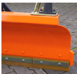
Abkantung im seitlichen und oberen Schildbereich